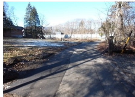
↑ 東側町道が拡幅舗装されました。