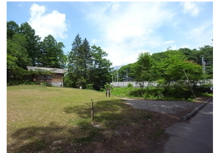
浅間山が見えます♪