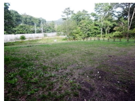
↑東側町道が拡幅舗装されました。