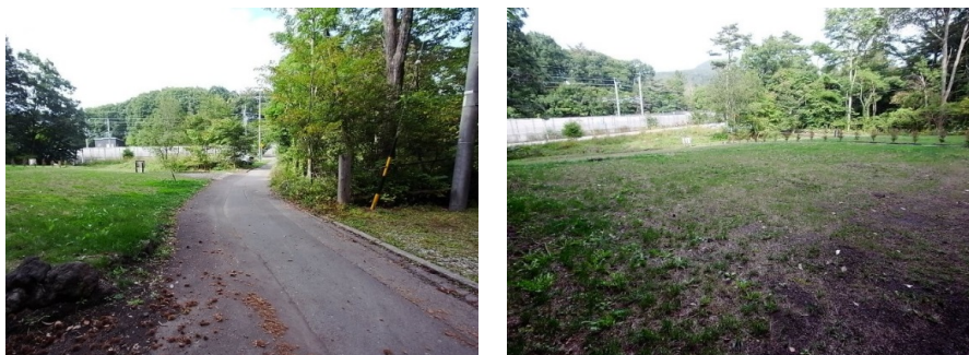
↑東側町道が拡幅舗装されました。