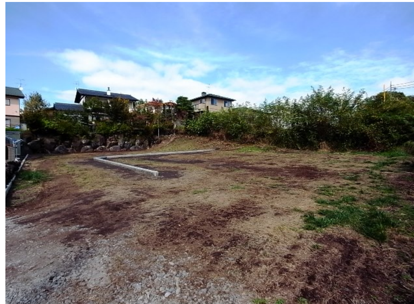
手前がB区画で、奥側がA区画となります。

建築条件無し(お好きなハウスメーカー様で建築可能です♪) 御代田町の『市街地整備ゾーン』に隣接しており発展が見込まれます。