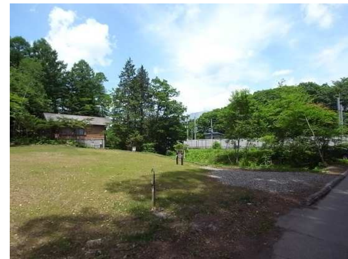
浅間山が見えます