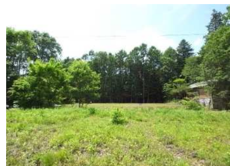
東側町道が拡幅舗装されました。