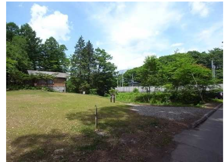
浅間山が見えます